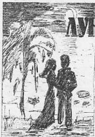
Рисунок Лены Нигматуллиной