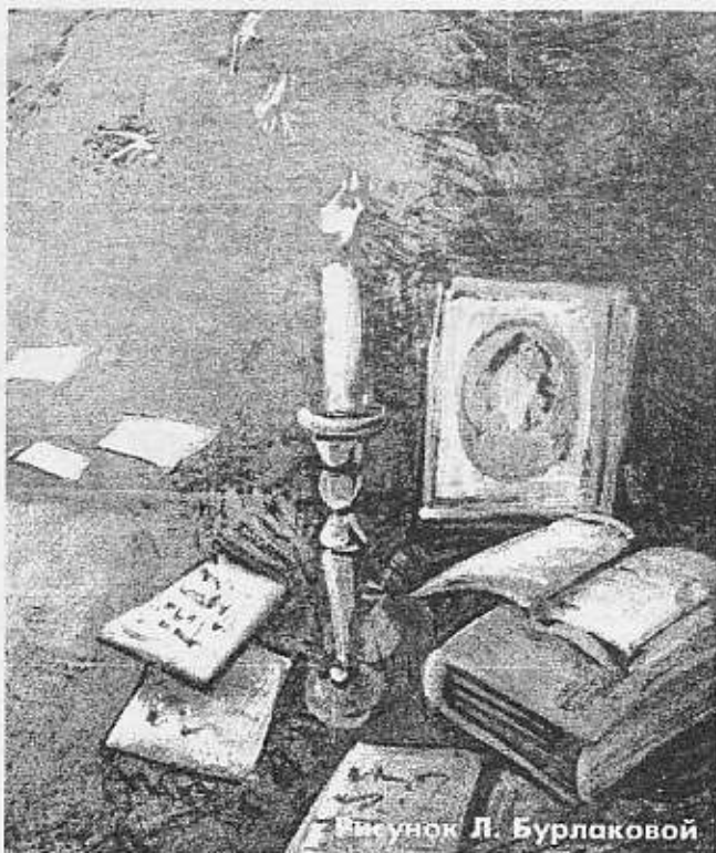
Рисунок Л. Бурлаковой

Дерзай, студент! Да вдохновит тебя пушкинская лира!